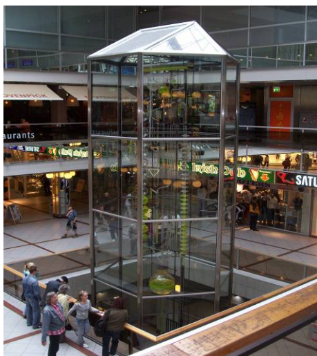
Klockan i Europacenter vid Ku'damm

Eftersom utomhusaktiviteter inte var att tänka på, blev det inköp av grejor till barnbarnen samt fika med jätteglass på Europacenter.