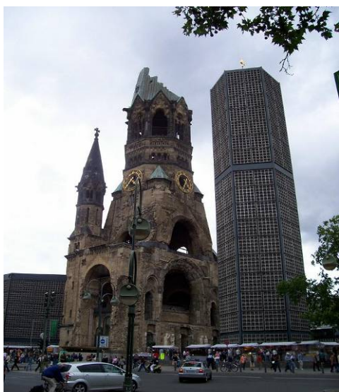
Vad är det som växt upp bredvid kyrkan?

Eftersom utomhusaktiviteter inte var att tänka på, blev det inköp av grejor till barnbarnen samt fika med jätteglass på Europacenter.