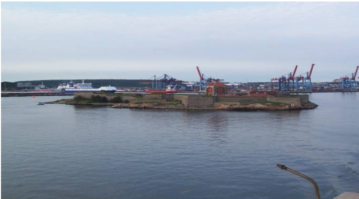
Hej då Göteborg å Sverige, (på ett tag)

Vi kom tyvärr på att kartan för planering av morgondagen låg i tryggt förvar nere i hojen. Det lilla bekymret får lösas när vi kör av färjan. Nog för dag 1. Go´natt.