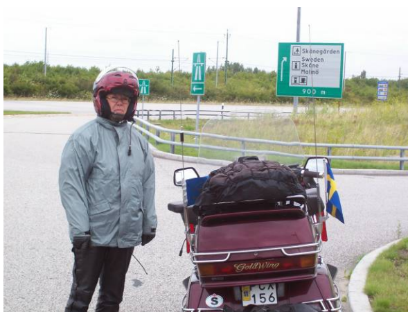
Åter till sommaren i Sverige 07

trots vädret. Om ni undrar så behövs regnstället på hela tiden i dag. Alltid lär man sig något. Väl framme vid bron över till Fehmarn tog det stopp. Vagarbeten. Smög ett tag, men efter några kilometer på 1:an, smög vi om istället. Klar fördel med hoj. Själva bropassagen var definitivt ingen höjdare. Kraftig, ryckig sidvind. Kändes som hojen låg i 30 graders vinkel. Dock, uppe vid färjan före 13.00. Ett besök i bordershop var ju inplanerat. Topboxen var inga som helst problem att fylla visade det sig. Vi fick trycka in överskottet i sidboxarna. Nästa steg hade varit att börja sortera bort kläder. In i kön till färja. Flyt, i princip bara att köra på. Vi tänkte kaka på båten för att slippa ett extra stopp. Spagettin ser väl bra ut. Stort misstag. Den hade säkert blivit kokad x antal gånger. Ingen smak och vattnig. Nåja, shit happens. Resan genom ett blåsigt Danmark drar vi ett fetstreck över. Äntligen framme vid Öresundsbron. Körning över perfekt. Vind i ryggen, solen saknades tyvärr, samt känslan att åter vara i gamla Svedala. Konstigt. Det känns så varje gång man kommer över gränsen. Kan ju i sig vara något vi är ganska ensamma om men så är det för oss. 165 spänn kostade det att komma in. (enkel) Billigt för den känslan tyckte vi.