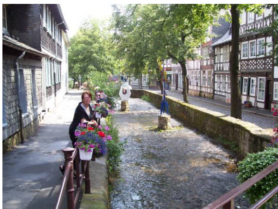
Fin utsikt i Goslar.

Dagen ägnades åt shopping. Vi hann dock med cappucino med glass. Beslöt oss också att för att ta hojen på eftermiddagen för att kika på omgivningarna, samt hitta ett bra ställe att koka middag på. Tydligt slet shoppandet på krafterna, då en liten e.m. lur poppade upp som prio ett. Till slut kom vi i alla fall iväg. Skärpan kan inte ha varit på topp, då vi definitivt kom någon annanstans. Efter lite vingel hit och dit, hamnade vi åter på hotellet. Snabbt ombyte och ned till kinamannen i närheten. Inget fel i det. Käket var helt ok. I morgon bär det av ut på vägen igen. Dock, vädret är inte lovande. Helt klart regnvarning.