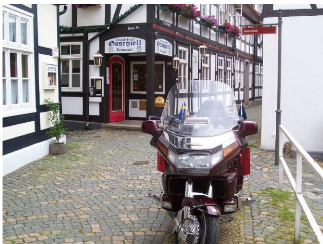
Schysst hoj framför schysst Gasthaus

Efter att vandrat omkring i stan kan jag säga: Är ni i närheten. Planera in någon dag. Det är denna stad verkligen värd. Våldigt hög mysfaktor. I morgon får det bli både riktig shopping och en rundtur uppe i bergen häromkring.