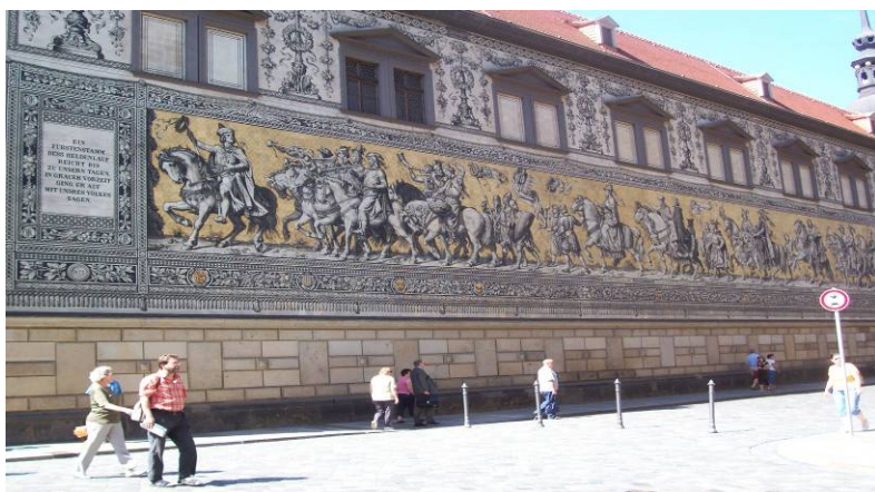
Kejsarparaden i Dresden

Dagen ägnades åt besök i Dresdens altstadt. Otrolig förändring sedan vi sist var här för 2 år se'n. Bland annat har man färdigställt den under kriget helt mosade Frauenkirche. Större delen av kostnaderna, (200 milj euro) har tydligen skänkts av alla möjliga personer och organisationer. Man har med hjälp av gamla ritningar puzzlat in 8000 stenblock som hittats i ruinerna. Totalt består kyrkan utvändigt av 360.000 block. Här finns massor av historia att kika på, bl.a. Semperoperan, Furstetåget och der Zwinger för att nämna några.