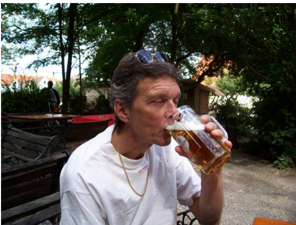
Ser ni hur gott det är??

Väl där, så var det bara att checka in. Eftersom villan är helt rökfri, så ville våra värdar tydligen hjälpa oss förtappade av bli av med beroendet, och skickade upp oss högst upp. Det är ju ett sätt att minska på intaget. Vete tusan vem som tipsat dem om våra laster. Hög mysfaktor var det i alla fall. Besök rekommenderas verkligen. Middag var beställd, så vid 19- tiden serverades det köttbullar o ris. Nja, inte riktigt som mammas men det smakade bra. Glömde förresten dagens höjdare. Vi beställde in varsin "bier". Ni som känner mig vet om de bekymmer som varit. Det har bl.a. betytt ingen öl på 1,5 år. Ingen stor sak kanske, men ändå. Den känslan jag hade i det ögonblicket måste upplevas.