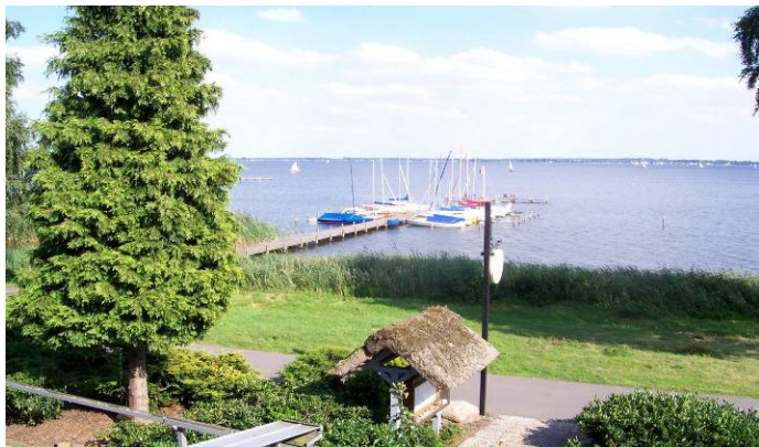
Sjöutsikt var det ju

något. Efter lite vingel i området kommer vi till vägs ände. Återvändsgata. Dock, där ligger hotellet. Efter check med värdinnan, så är allt klart. Rum med sjöutsikt erbjuds.