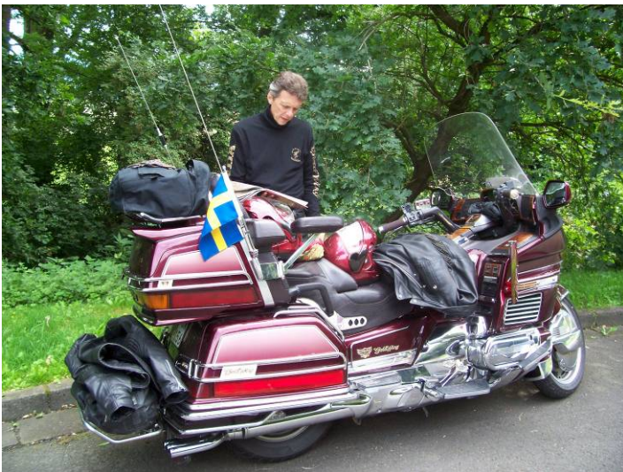
Kolla kartan var det ja