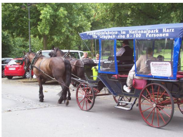
Andra hästkrafter på gång

Efter att vandrat omkring i stan kan jag säga: Är ni i närheten. Planera in någon dag. Det är denna stad verkligen värd. Våldigt hög mysfaktor. I morgon får det bli både riktig shopping och en rundtur uppe i bergen häromkring.