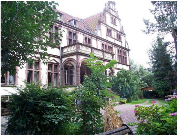
Vi hittade villan

Sista biten ned till Lauenförde var snart avklarad, och återstod gjorde bara att lokalisera Villa Löwenhertz.