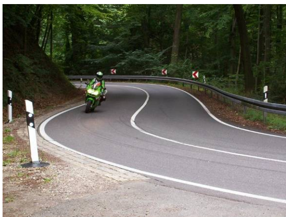
Här var det drag.