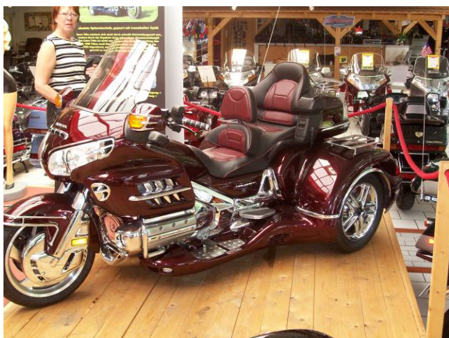
Något för framtiden kanske.

Beslöts att vi får vara, och är väldigt nöjda med nuvarande wingen. Tyvärr, så var inte det nybyggda huset för trikar öppet. Märkligt men sant. Varför kan man ju undra. Kanske de inte ville bli av med sina pärlor, och stå med ett tomt nybyggt hus. Efter väl förrättat värv, det vill säga ögonen vara mätta, inköptes en guldörn som minne. Kommer att sättas på toppboxen framöver. Det tyckte kassan var ok. Vi bestämde oss för en liten rundtur i området, i syfte att dels se oss omkring dels hitta det där fantastiska stället för vår picnic. Gick väl hyfsat på båda fronter kan man väl tycka. Mackorna, soppan och kaffet slank ned på en så där rastplats.